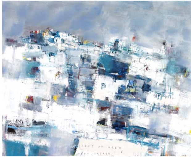
Stadt am Meer, Acryl auf Karton, 80 x 98 cm