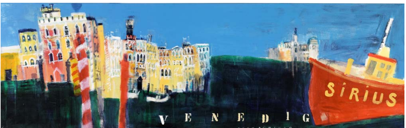
Venedig, 2009, Acryl auf Leinwand, 50 x 160 cm