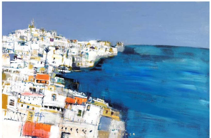
Weisse Stadt am Meer, 2008, Acryl auf Leinwand, 80 x 120 cm