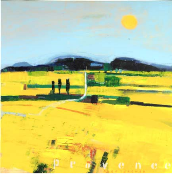
Provence, 2009, Acryl auf Leinwand, 100 x 100 cm