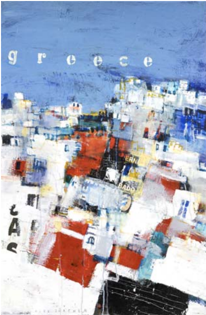
Greece, 2008 Acryl auf Malkarton, 80 x 120 cm

Alex Zürcher, geboren 1949 in Bern, ist freier Maler, Lehrer für Bildnerisches Gestalten und leitet Malkurse. Seine Werke sind seit 1987 an verschiedenen Einzelausstellungen vertreten und erstmals in Basel zu sehen.