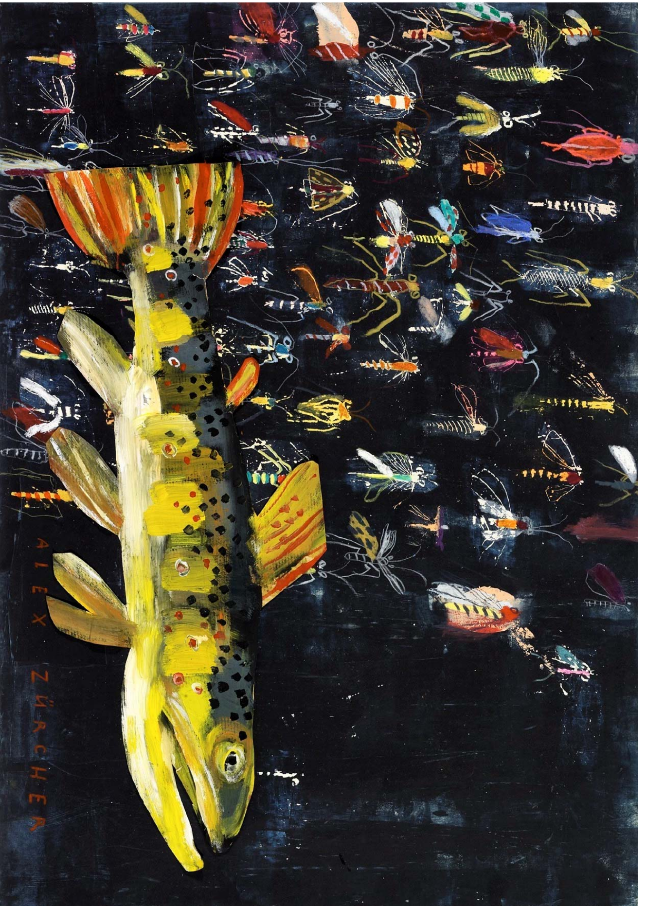
Bachforelle und Insekten, 2009, Mischtechnik, Collage auf Papier, 50 x 70 cm