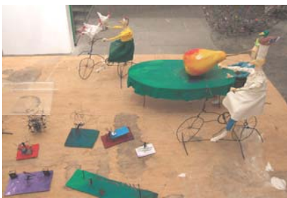
Ansichten aus dem Atelier