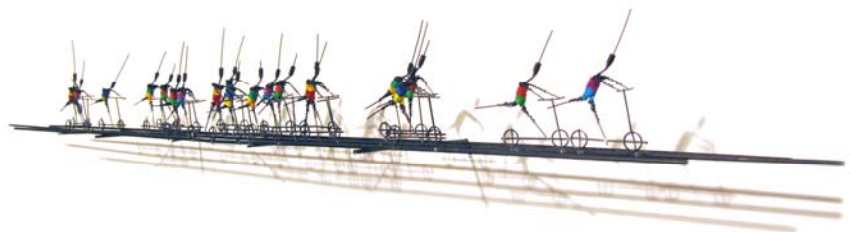
Frührentner, 2011 Draht, Ton, 12 x 80 x 10 cm

Celui qui s'immerge dans cet univers réalise à quel point ses œuvres peuvent être à double sens, ses idées subversives et exprimer des tragédies humaines.