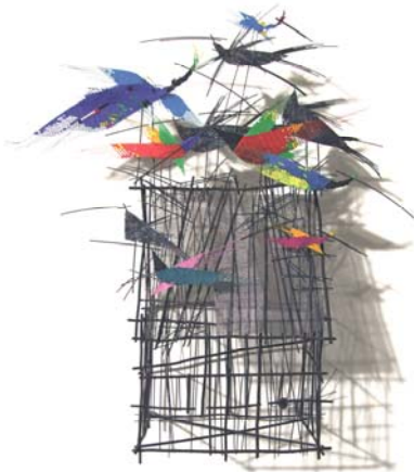
Dachdecker, 2011 Draht, Gewebe 28 x 20 x 18 cm